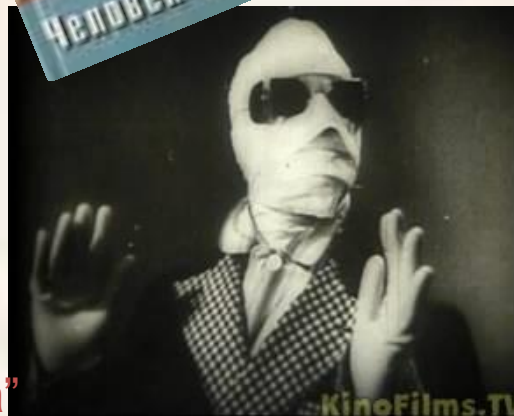
Кадр із фільму “Людина-невидимка”