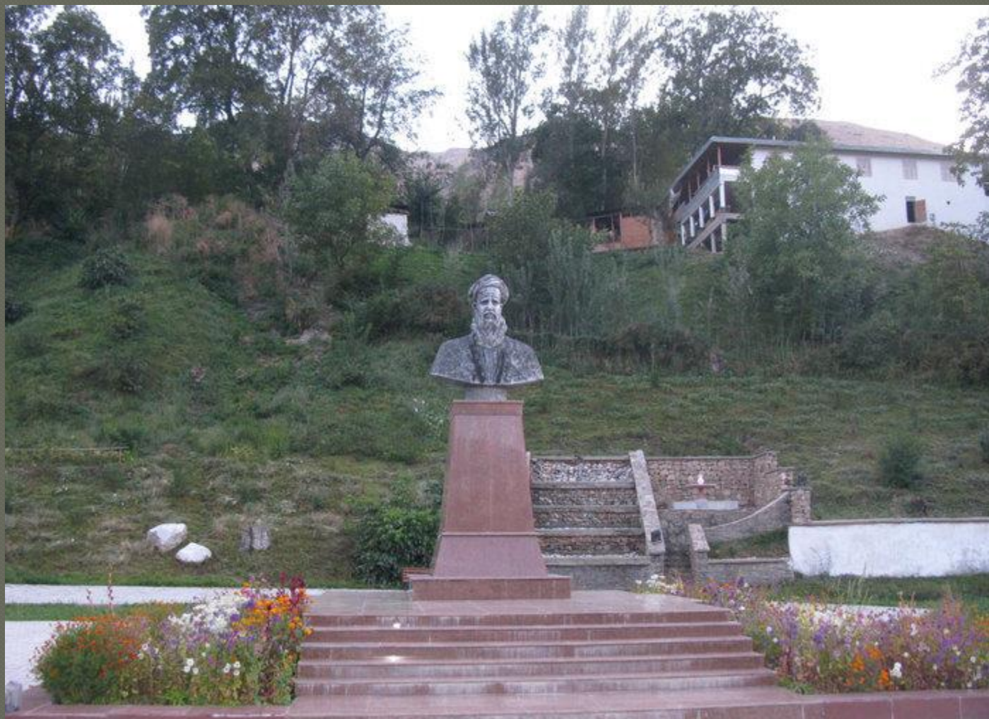
Пам'ятник Рудакі у Панджруді