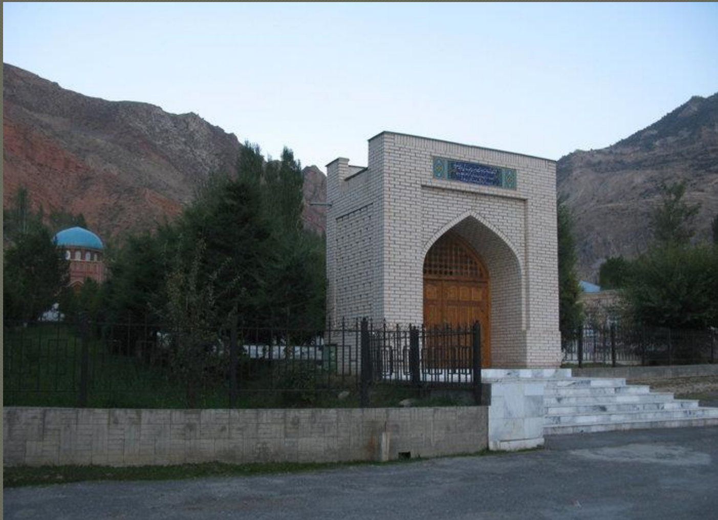
ВХІД ДО МАВЗОЛЕЮ РУДАКІ