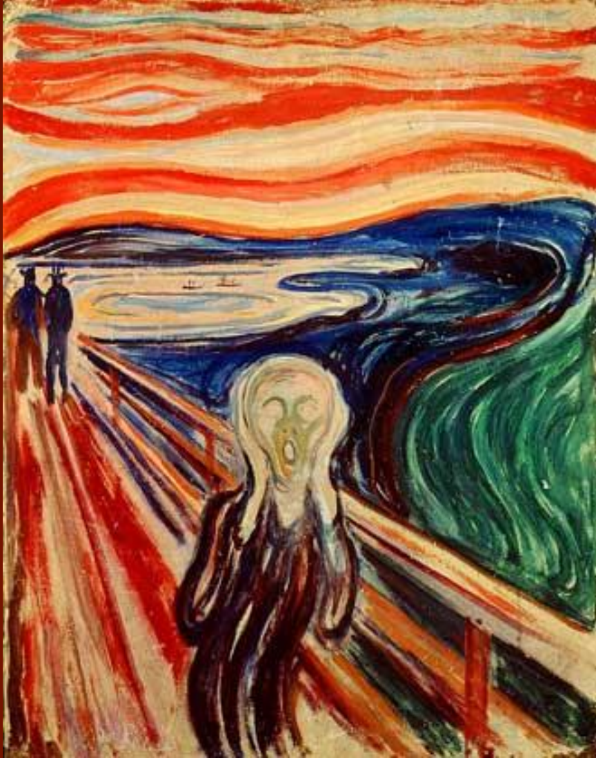
Е Мунк «Крик»