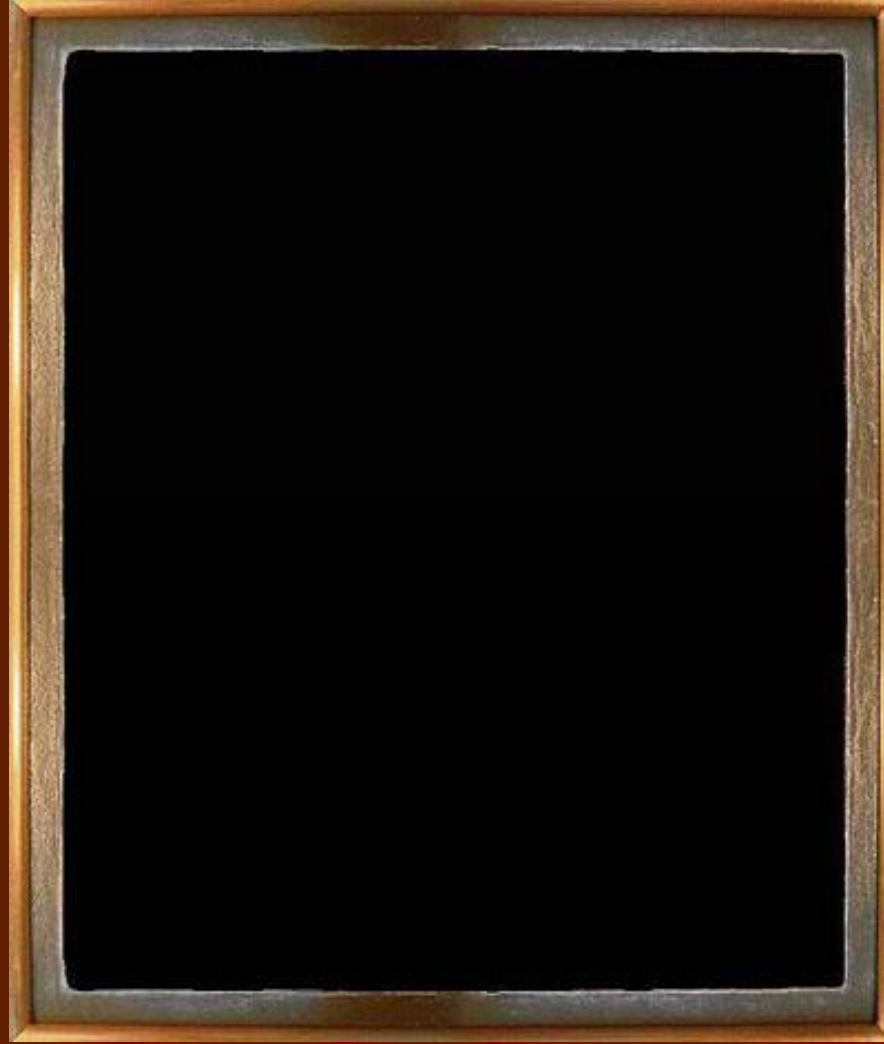
К.Малевич «Чорний квадрат»

Завдання для груп: пов'яжіть картину «Чорний квадрат» із твором Кафки.