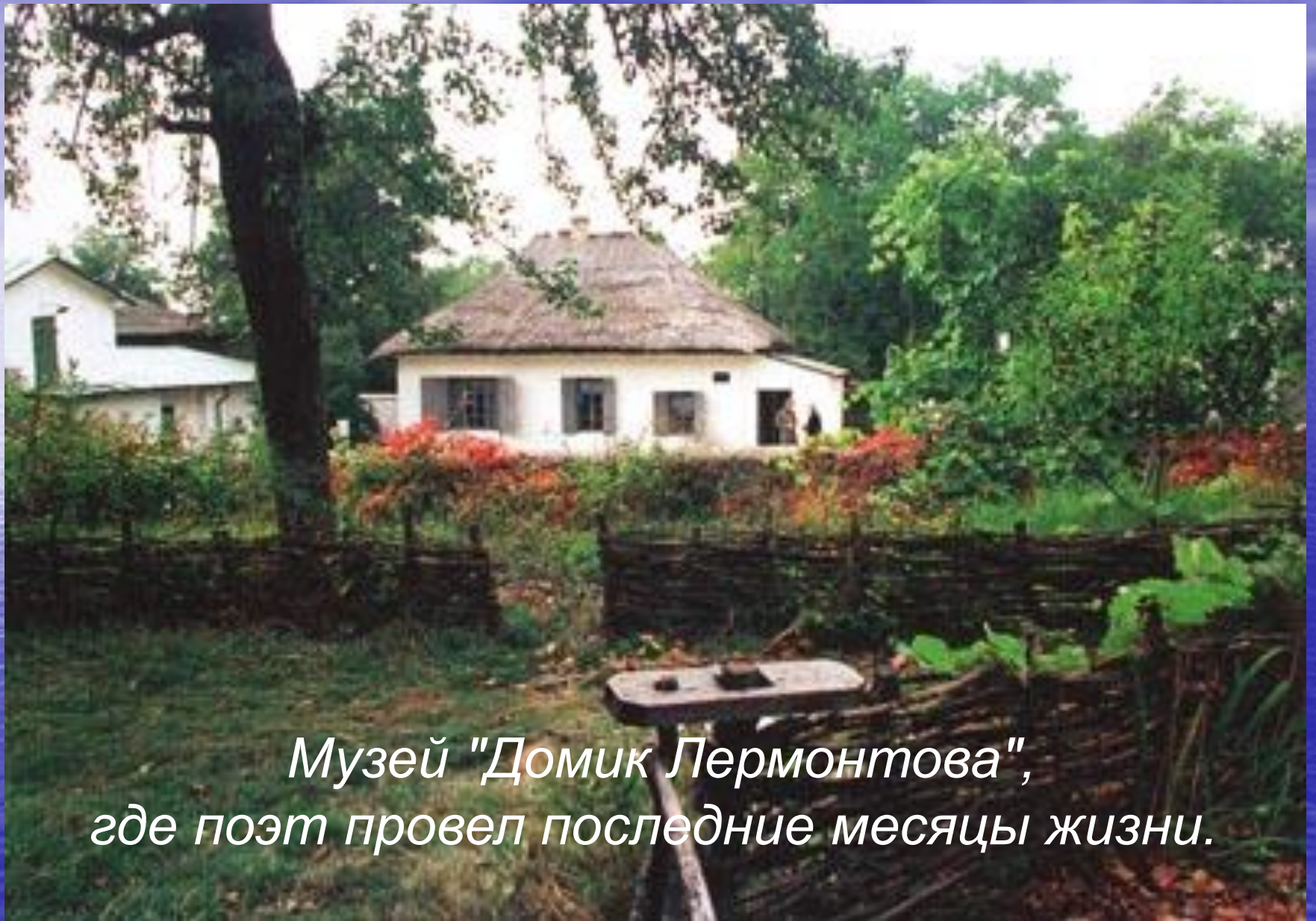
Музей "Домик Лермонтова", где поэт провел последние месяцы жизни.